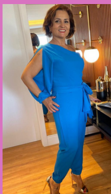
Imagem forte, poderosa, firme, visual cosmopolita.

Alerta: excesso de segurana e poder pode afastar as pessoas.